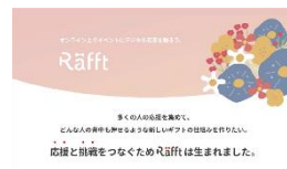
「Raftt(ラフト)」 新しいデジタルギフト プラットフォーム (K.627株式会社)