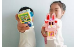
ピコンの人気工作イベント (株式会社ピコトン)