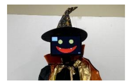
ロボットハロウィン ～ロボモンからの挑戦状～ 凸版印刷株式会社