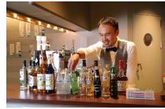
親子で参加！ キッズバーテンダー体験！ ※ (アトレ竹芝店 SHAKOBA)