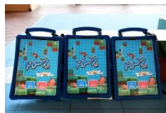
ドローンを自由に 動かしてみよう！ (ラフ&ピースマザー)