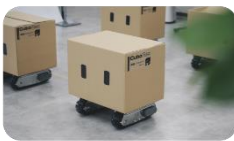
CuboRexの“CuGo”で 未来のロボットを考えよう！ (CuboRex)