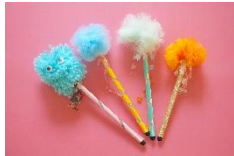
オリジナルタッチペンを つくろう (乙女電芸部)