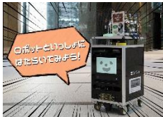
ロボットと一緒に 働いてみよう ※ (ソフトバンク株式会社)

ロボット・VR・ドローン・メタバースをつかった未来の遊びと学びが体験できます。※は事前予約制。