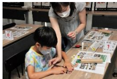
海藻万華鏡づくりワークショップ ※ (東京ガス株式会社、 モバイルラッコ隊、海藻おしば協会)