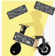
折り畳み変形バイク 「タメルバイク」 (株式会社ICOMA)