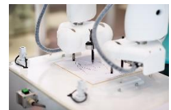
duAroの似顔絵体験 (川崎重工株式会社)