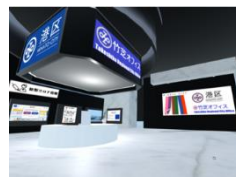
みなと区役所竹芝オフィス (港区情報政策課デジタル推進担当)