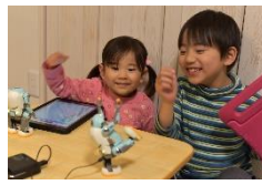
あるくメカトロウィーゴと プログラミング体験をしてみよう！ (株式会社リビングロボット)