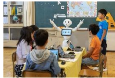
ロボットプログラマーになろう！ Pepperを使ってプログラミング体験 ※ (ソフトバンク株式会社、 ソフトバンクロボティクス株式会社)