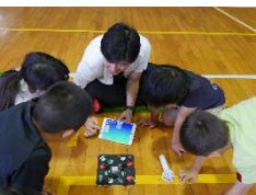
ドローンプログラミングで 『ハロウィン城』障害物コースを クリアしよう！ (株式会社Dron é motion)