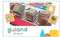
食卓は、おっきな学び場だ ～プログラミング的思考編～ (ビービーメディア株式会社)