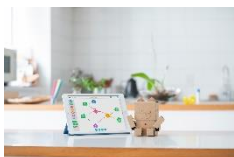
embotでロボットプログラミング！ ボールを速くまで 飛ばすマシンを作ろう！ ※ (株式会社e-Craft)