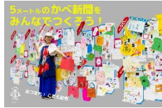
あつまれ！キッズプレス (ベイビートイの アートデザインラボ)

会場に集合するのは、造形、絵画・イラスト、音楽、身体表現、ゲーム・クイズ、環境・自然など様々なジャンルのワークショップ。よりすぐりのプログラムが集まり、こどもたちの想像力・表現力を刺激します。※は事前予約制。