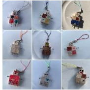
ロボットの キーホルダーづくり (そらいろ☆こどものアトリエ☆)