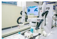
カワサキロボット エンジニアになろう！ (川崎重工株式会社)