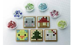
わくわくコースター (メロンモザイク)