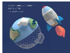
デジタルツインを体験しよう！ VR×謎解きゲーム ※ (慶應義塾大学メディアデザイン研究科 Social Creation)