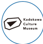
角川武蔵野 ミュージアム