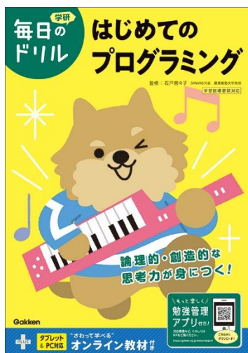
毎日のドリル はじめてのプログラミング