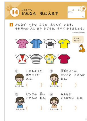
『はじめてのプログラミング』より