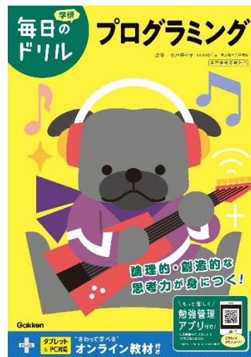
毎日のドリル プログラミング